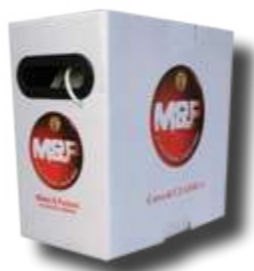
SCATOLA con bobina svolgicavo SPEEDY 5 e SPEEDY 6