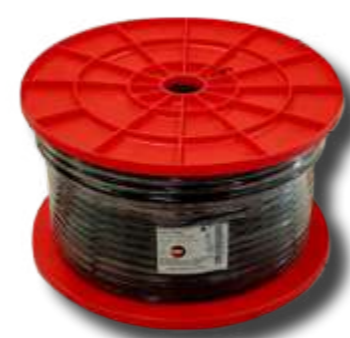
BOBINE CAVI COASSIALI