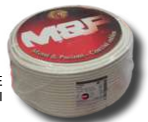
MATASSE CAVI COASSIALI